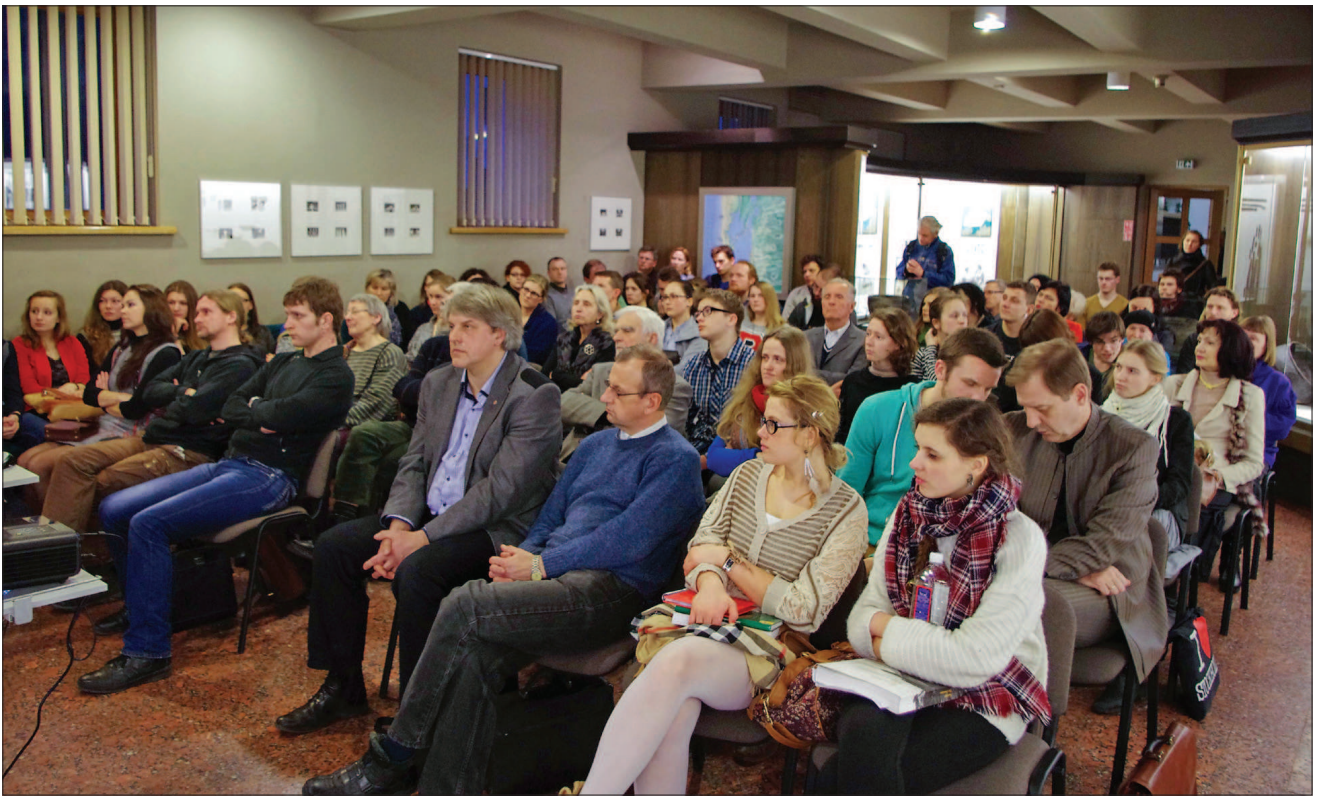
3 pav. 2014 m. vasario 19 d. M. Gimbutienės skaitymų erdvė.