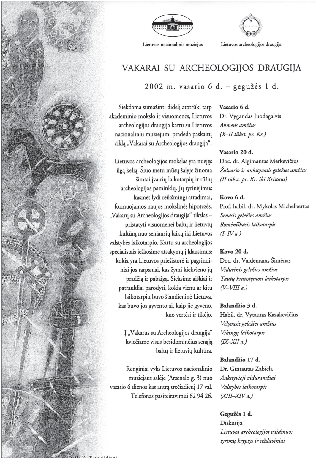
1 pav. 2002 m. Lietuvos archeologijos draugijos ir Nacionalinio muziejaus paskaitų ciklo skelbimas. Dailininkai V. ir R. Tarabildos.