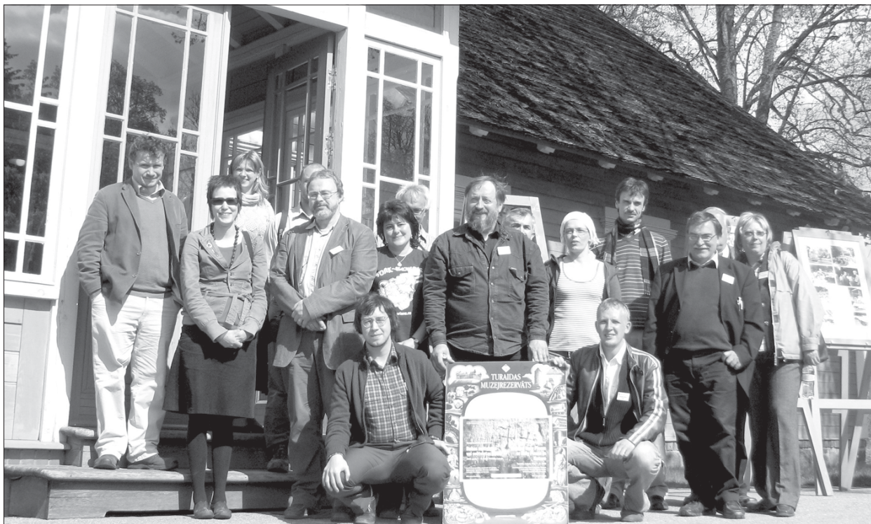
1 pav. Konferencijos dalyviai prie Turaidos muziejaus.

išgirdo apie „sieidi“ – Sámi genties aukojimo vietą, jos lokalizaciją ir klasifikaciją.