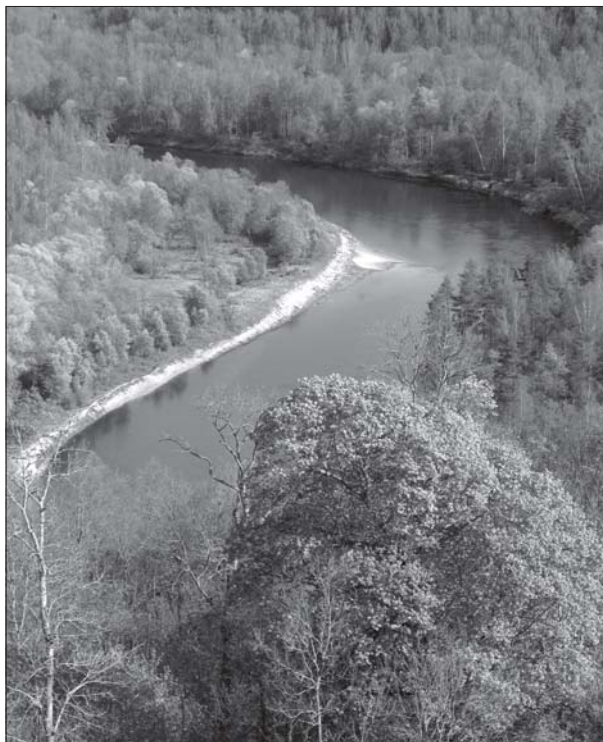
6 pav. Gaujos gamtos rezervatas.