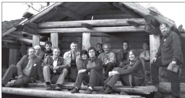
4 pav. Konferencijos dalyviai Araiši archeologiniame komplekse.