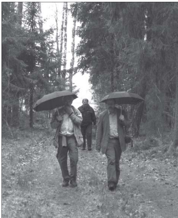
2 pav. Pakeliui į Rāmati uolas.