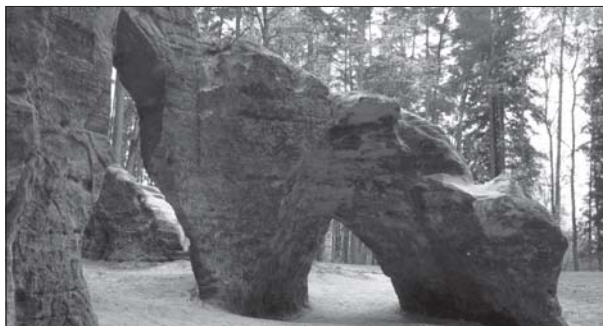
5 pav. Urvas „Velnio krosnis“.