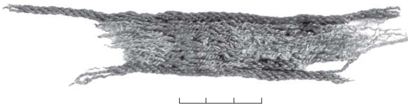
3 pav. Požerė, kapas 146. Vytinė juosta.

duomenys padeda spręsti audinių importo, vietinių tradicijų ar kitų regionų įtakos klausimus.