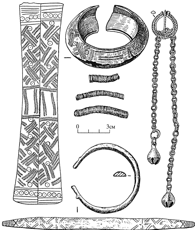
Рис. 3. Украшения из кургана № 13 у д. Укля Браславского района Витебской области.

Восточной Латвии (Люцинский, 1893. Табл. V; Нукшинский, 1957. Табл. III). Кроме того, в описываемом могильнике найдены части двух зооморфных браслетов.