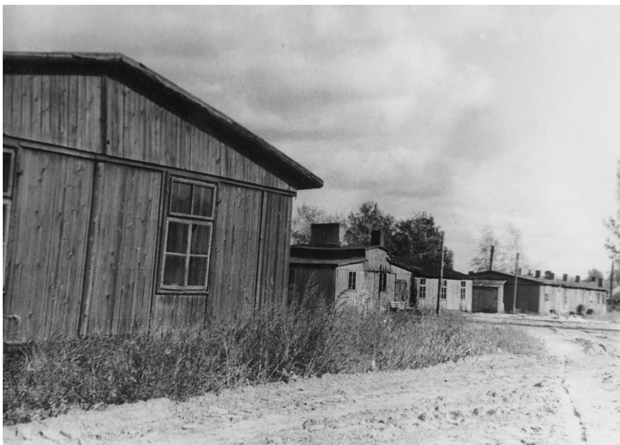
3 pav. Macikų lageris XX a. 7 deš.

Knygoje „Macikų mirties namai“ rašoma, kad pirmieji civiliai politiniai kaliniai (120 vyrų ir 80 moterų), dauguma nuteisti pagal sufabikuotus politinius kaltinimus, į lagerį buvo atvežti iš Šiaulių kalėjimo (Burauskaitė, Jankauskienė 2015: 112). Didžioji dalis lagerio kalinių buvo neįgalieji, vežti ne tik iš Lietuvos, bet ir iš rytinių SSRS sričių. Nuo kitų Lietuvoje veikusių kalinimo įstaigų ši išsiskyrė tuo, kad čia buvo įkurti Motinos ir vaiko namai. Juose buvo kalinamos ir moterys bei jų vaikai, gimę kalėjime ar lageryje.