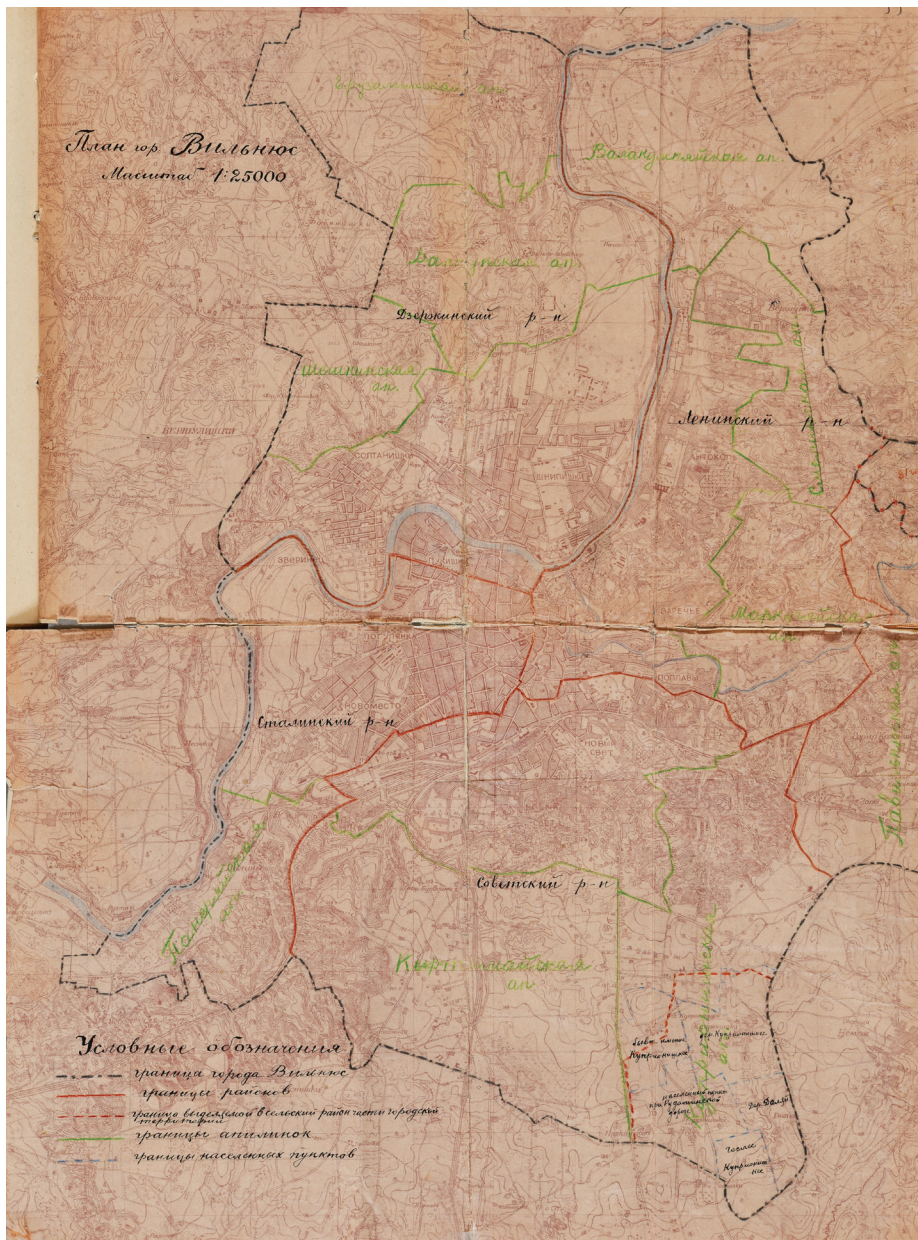
2 pav. Vilniaus miesto teritorija šeštojo dešimtmečio pradžioje. LCVA, f. R-758, ap. 4, b. 330, l. 59.