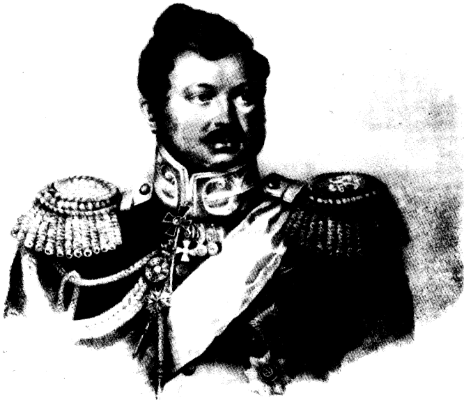
ГЕНЕРАЛЪ АДЪЮТАНТЪ КНЯЗЪ С. ДОЛГОРУКОВЪ