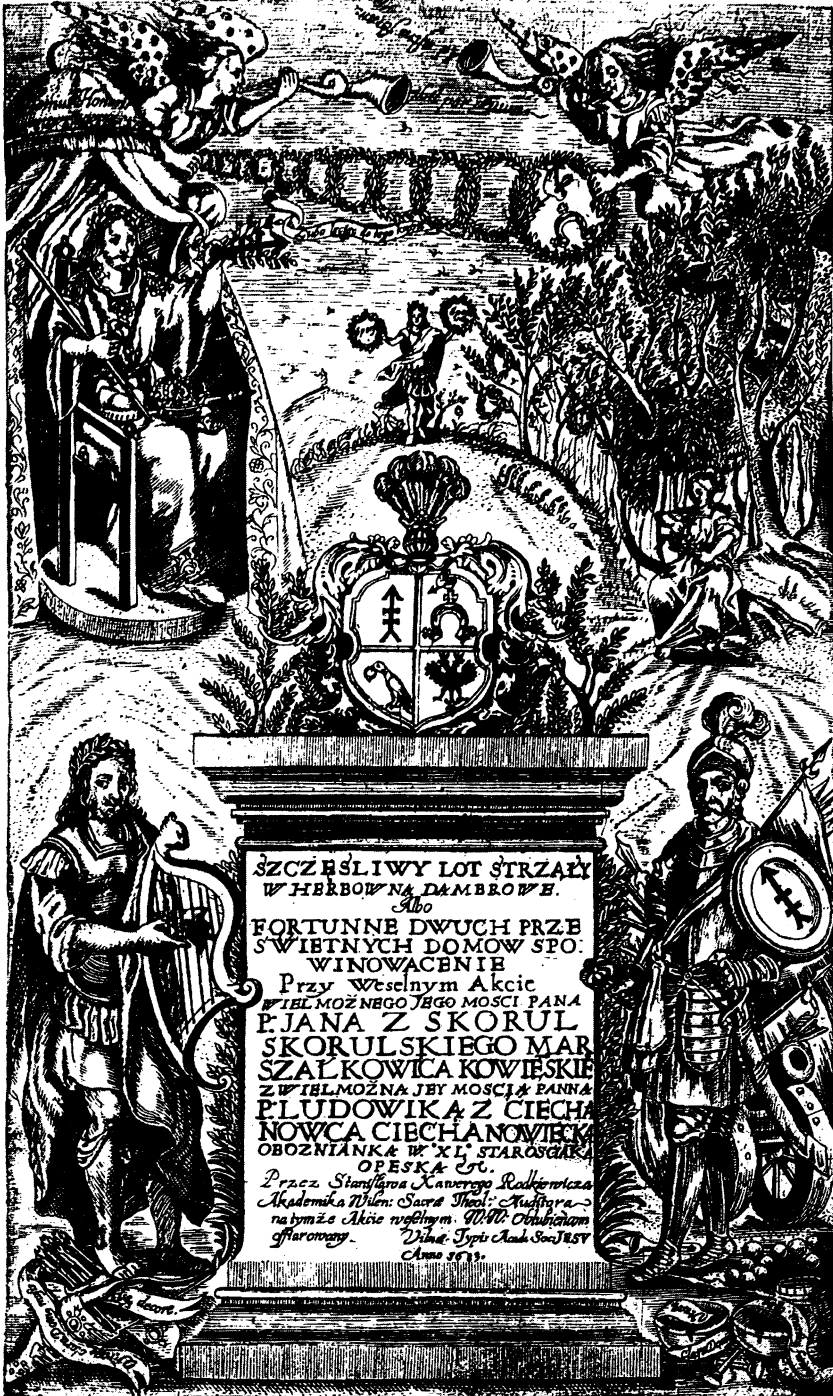
1 pav. 1683 m. Kauno maršalaicio vestuvių epitalamijo frontispisas