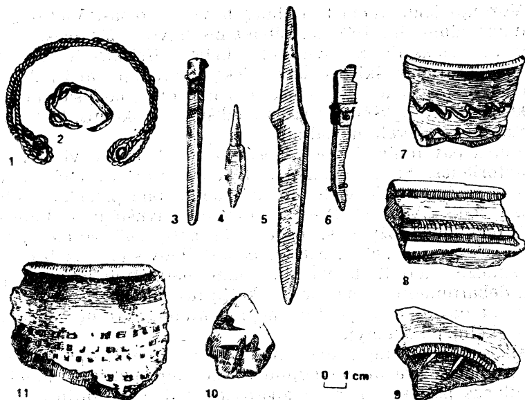
3 pav. 1990 m. tyrinėto Seimyniskėlių piliakalnio radiniai: 1 — vytinė apyrankė, 2 — žiedas, 3 — geležinis strėlės antgalis, 4 — arbaletos strėlės antgalis, 5 — peilis, 6 — peilio kriaunos, 7—11 — keramika

tai rodo čia buvus stulpais paremtų galerijų, esančių vidinėje gyveninių sienų pusėje. Ryškesnių degusių pėdsakų, kaip ir židinių, nerasta. Kadangi ištirta maždaug tik 1/25 piliakalnio aikštelės, būtų per drąsu kalbėti apie pastatus. Aikštelės pakraščiai sutvirtinti plūkto molio sluoksniu, pietryčių pylimas irgi plūktas iš molio, kuris, sprendžiant iš žmonių pasakojimų, buvo sutvirtintas rąstų konstrukcijomis. Kokių ryškesnių remonto ar perstatymo pėdsakų nepastebėta, tačiau apie tai kalbėti per anksti, nes nepadarytas pylimo pjūvis. Surinkta medžiaga chronologiškai vienalytė (3 pav.). Keramika žiesta, puošta bangelėmis arba keturkampiu spauduku. Vienas puodo dugnas su ženklu. Ženklintų puodų XIII—XIV a. pasitaiko tik dideliuose centruose 105 . Iš geriau datuotų radinių minėtini geležinis arbaletos strėlės antgalis, žalvarinė vytinė apyrankė. Panašios būdingos XII a. antrosios pusės Novgorodo apylinkių slovenams 106 , XII—XIII a. Kostromos Pavolgio viatičiams 107 . Jų rasta Asutės (Latvija) piliakalnio XIII a. sluoksniuose 108 , Slobodkos (Oriolo sritis) piliakalnio XII a. antrosios pusės—XIII a. pirmosios pusės sluoksniuose 109 . Lietuvoje vytinių apyrankių negausu 110 , panašios skiriamos XII—XIII amžiui 111 . Analogiškas arbaletos strėlės antgalis rastas Asutėje irgi XIII a. sluoksnyje 112 . Lietuvoje XIV a. aptinkama gerokai masyvesnių antgalių 113 .