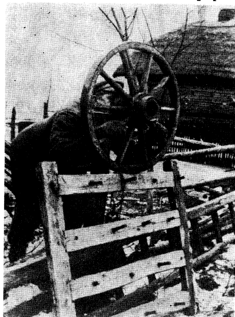
Pučia stebulę (Telšių raj. Gardiškės apyl. Jonelaičių k. V. Trinkos 1935 m. nuotr.; ŠAM, neg. Nr. 913)

XX a. pamažu keičiantis ūkio kryptis, didesnėje teritorijos dalyje vietoj merkutinio ėmus gaminti klotinį linų pluoštą, linus, kaip ir visus kitus javus, tiek pardavimui, tiek savo ūkio reikalams imta kulti tik rudenį. Pagal liaudies kalendoriaus terminologiją javus, ypač samdytą darbo jėgą naudojusiuose ūkiuose, buvo stengiamasi iškulti „iki Martyno“, o vėliausiai — „iki Kalėdų“. Martyno diena ir Kalėdos imta laikyti tradiciniais kūlimo pabaigos terminais. Kai kur ligi to laiko kūlimo nebaigę valstiečiai būdavo pašiepiami kaip apsileidėliai 22 . Atsirado paprotys kaimynams tarpusavyje lenktyniauti. Apie kūlimo pabaigtuves buvo pranešama savotišku signalu — pučiant stebulę (žr. pav.). Kad jos garsas toliau girdėtųsi, medinė seno tekinio stebulė būdavo įkeliamą į medį, žardą ar bent ant tvoros statinių. Šis paprotys dar 1935 m. užfiksuotas Žemaitijoje, dabartiniame Telšių rajone.