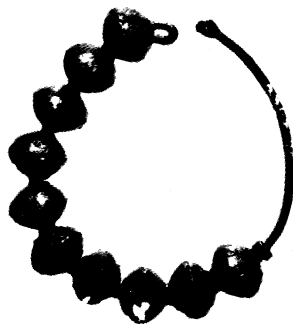
2 pav. Bulgarų kunigaikštienės Desislavos portreto fragmentas (freska Šv. Bojano cerkvėje prie Sofijos, tapyta 1259 m.) ir daugiakarolis antsmilkinis iš Gėluvos. Kunigaikštienė pasipuošusi daugiakaroliais antsmilkiniais.