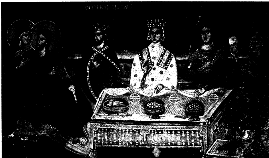
3 pav. Freska „Vestuvės Kanoje“ (Šv. Nikolajaus Orfanos cerkvė Tesalonikuose, XIV a. pradžia). Nuotaka pasipuošusi daugiakaroliais antsmilkiniais.