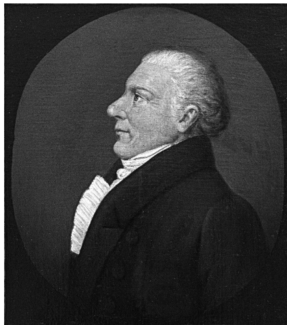
1. Mauricijus Pranciškus Karpis (1749–1817) – Žemaitijos kunigaikštystės pasiuntinys į Ketverių metų seimą (1790–1792 kadencijai), Jeano-Jacques'o Rousseau Pastabų Lenkijos valdymui ir numatomai jo reformai vertėjas į lenkų kalbą (1789), respublikonas publicistas, satyrikas, laisvamanis, Lietuvos preromantizmo filosofas. Lietuvos nacionalinis muziejus.

Lietuvių kalbos vartojimas konstitucinės valstybės kūrimosi epicentre, pilietiniuose ir patriotiniuose XVIII a. antrosios pusės kontekstuose – jau gvildenta