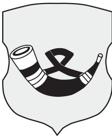
Рис. 2. Герб Копыля («поле золотистое с охотничьей трубой»). Реконструкция Андрея Шпунта и Андрея Левчика.

общины. Необходимые для нее решения принимались на собраниях ее актива (так называемые чиновниками «ходоки» и «запевалы»), которые происходили, как правило, в корчме. Обнаружены упоминания о том, что имелось общее денежное имущество, формировавшееся путем проведения складок внутри общины.