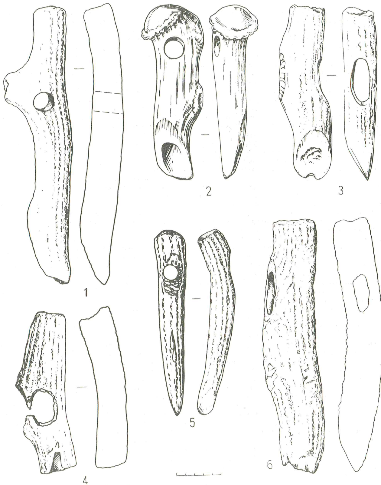
Рис. 1. Роговые орудия из Сморгонского местонахождения