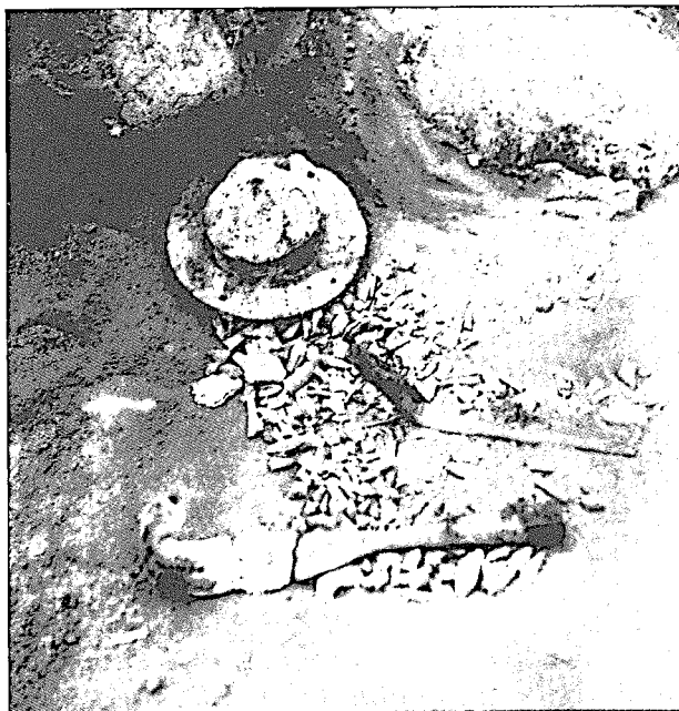
3 pav. Papiškių pilkapyne. Pilkapio 5 degintinio kapo 1 įkapės: kūgio formos skydo umbas, ietigalis ir peilis in situ . 1975 m. (LCVA ng. 1-35192).

se randami išimtinai griautiniuose arba degintiniuose kapuose. Pavyzdžiui, konkrečiame pilkapyne umbų randama tik griautiniuose (plg. Baubonis–Mustenius, Degsnę) arba tik degintiniuose kapuose (plg. Popus–Vingelius, Vilkiautinį, Vyžius). Tą patį galima pasakyti apie likusius komplekto elementus. Tad duomenys, kuriais šiandien disponuoja lietuvių archeologija, rodytų, kad perėjimas prie mirusiųjų deginimo papročio iš esmės truko tiek, kiek ilgai buvo naudojami daiktai iš minėto vyrų daiktų komplekto. Tiksliau sakant, kai šie daiktai nebebuvo naudojami, jų nebeliko ir tarp įkapių. O tuo metu kremavimo paprotys Rytų Lietuvoje, matyt, jau buvo visuotinio pobūdžio. Vadinasi, mirusiųjų deginimo paprotys Rytų Lietuvoje galė-