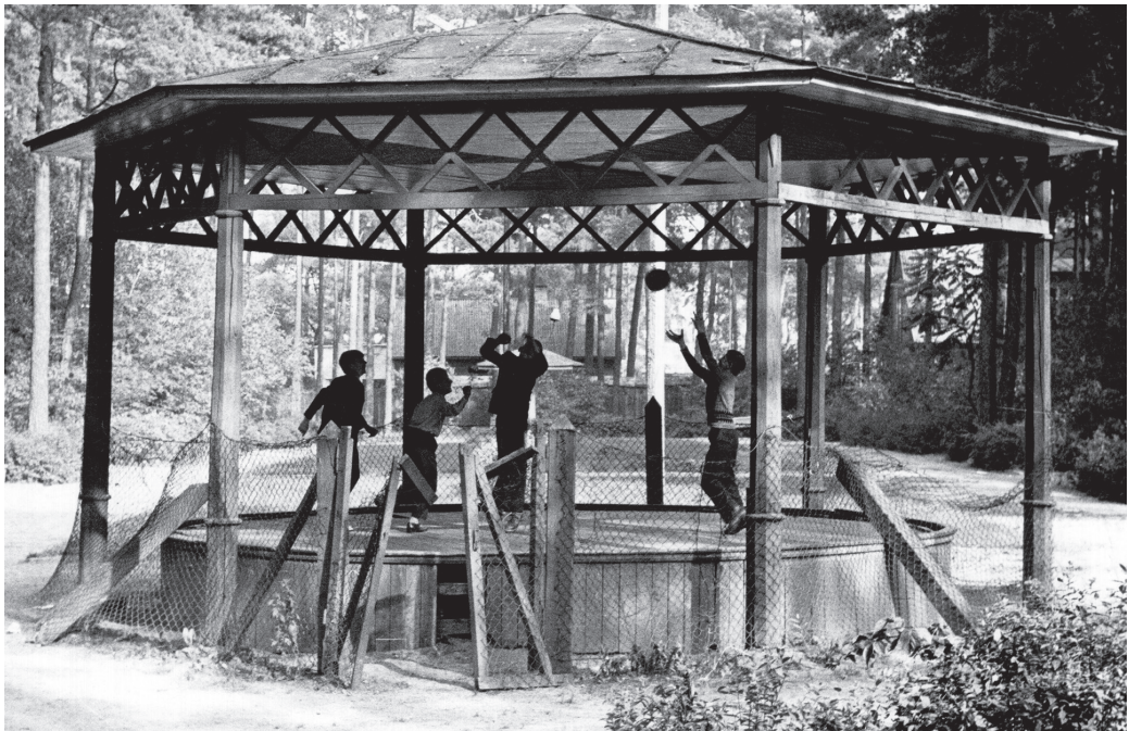
1 pav. Žaidžiantys vaikai sulūžusioje karuselėje Alytaus miesto parke. Išspausdinta „Šluotoje“ 1975 m. Nuotraukos originalas saugomas LLMA 1975, F 361, ap. 2, b. 306, l. 127

Netvarka viešojoje erdvėje kėlė nesaugumą, kurį laiškų autoriai siejo su įvairiais, net mirtiniais pavojais. Viename laiške Kauno rajono Babtų gyventojas rašo, jog dėl nesutaisyto kelio žuvo jaunas motociklininkas (LLMA 1975, F 361, ap. 2, b. 301, l. 13–14); kitame laiške pasakojama, kaip dėl duobės kelyje žmonės padarė avariją, keleiviui buvo sulaužyti šonkauliai ir sutrenkta galva; autobusas įvažia-