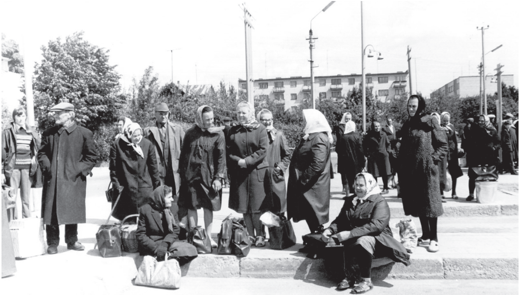
3 pav. Pasvalys, autobusų stotis. 1975 m. Išspausdinta „Šluotoje“ 1975 m. Nuotraukos originalas saugomas LLMA 1975, F 361, ap. 2, b. 306, l. 12