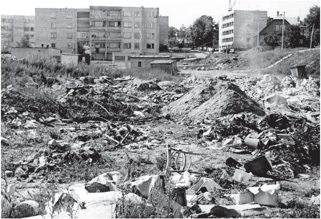
2 pav. „Iš tolo „šviečia“ būsiamasis Trakų stadionas...“, 1982 m. Neišspausdinta „Šluotoje“ Trakų gyventojų atsiųsta nuotrauka (LLMA 1982, F 361, ap. 2, b. 628, l. 9)

vęs į griovį išmušė vienai moteriai dantis, sutrenkė keleivius, kitas autobusas įkrito į griovį šalia kelio (LLMA 1975, F 361, ap. 2, b. 303, l. 155–156). Kiti skundėsi dėl neapšviestų gatvių ir viename laiške priminė, kad čia neseniai įvyko dar vis neišaiškinta žmogžudystė (LLMA 1980, F 361, ap. 2, b. 542, l. 107).