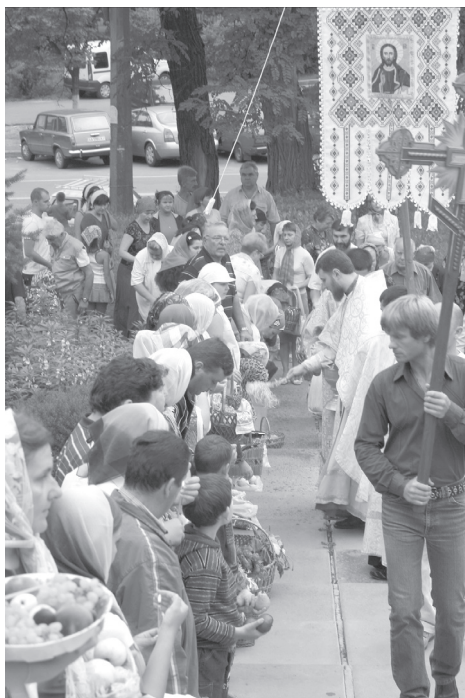
8 pav. Vaisių šventinimas per Kristaus Atsimainymo (Kristaus Išgelbėtojo (Spaso) šventę. Kijevas, šv. Feodosijaus Černigovskio cerkvė, 2008 m. rugpjūčio 19 d.

koje. Ukrainoje labiausiai piligrimų lankomos stačiatikių šventovės yra Kijevo Pečioros, Počajevo ir Sviatogorsko vienuolynai, graikų apeigų katalikų – Unevo vienuolynas ir Zarvanica.