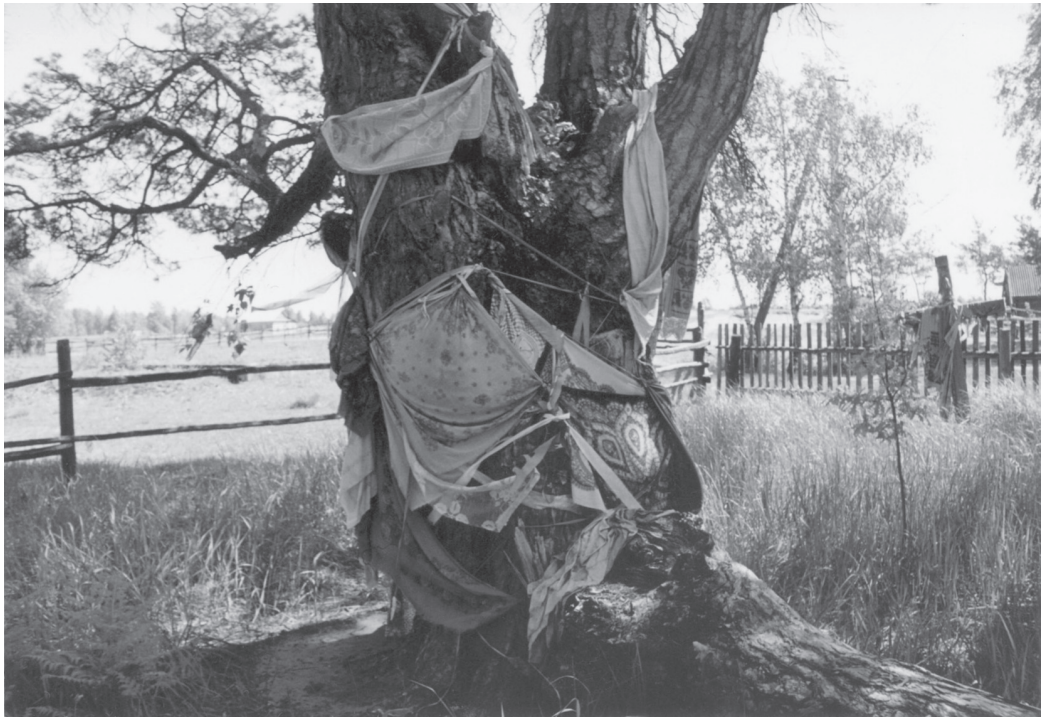
2 pav. „Medis karalius“ (trys kamieniai suaugę į vieną). Rovno sritis, Rokitnės rajonas, Veži kaimas, 2006 m.

asmeninėms, kartais ir kitų reikmėms. Ekspedicijoje mums teko sutikti moterų, kurios, kaip jos sakė, išmoko „maldų žmonėms pagelbėti“ iš mokslinių folkloro leidinių, taip pat bobučių, kurios migdo savo anūkus padedant plėšomame kalendoriuje perskaitytam užkalbėjimui nuo priešiškų būtybių, puldinėjančių ir taip virkdančių vaiką (ukr. k. jos vadinamos криклиці – nuo žodžio „rėkti“).