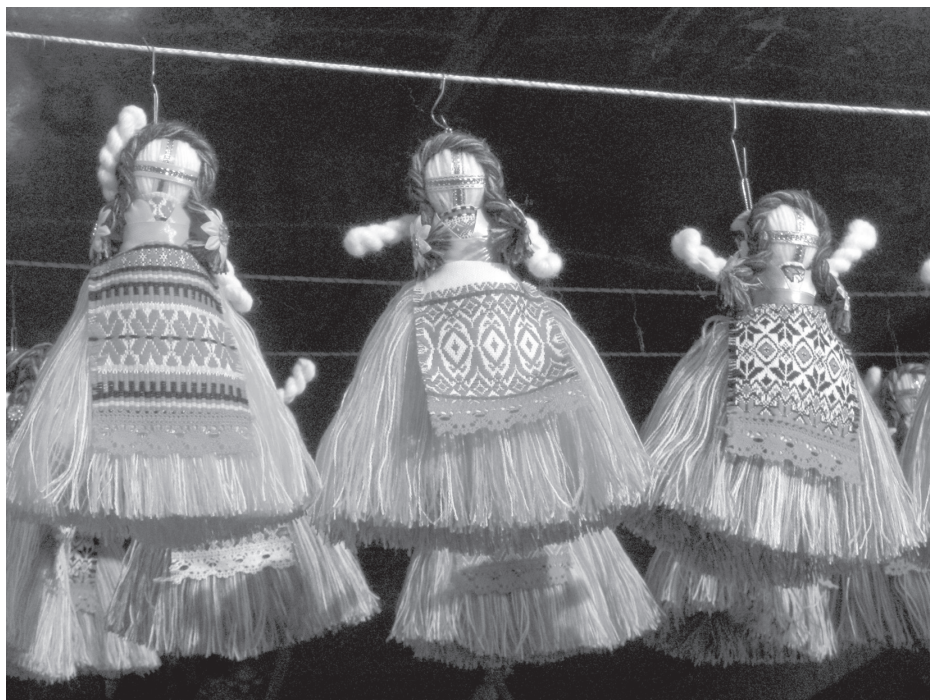
4 pav. Lėlės „motankos“. Kosovo miesto (Ivano Frankovsko sritis) turguje, 2012 m. liepos 9 d.

Pažymint įkurtuves, pirmasis į gyvenamąjį namą įleidžiamas katinas, o jau po to šis būstas yra šventinamas. Įdomu tai, kad žmonės abu šiuos papročius laiko „savais“, tradiciniais. Šiuolaikinio namo (esančio mieste) interjere dažnai galima pamatyti varpelius, ksilofonus – piktajai dvasiai atbaidyti, turkiškus akies pavidalo talismanus nuo nužiūrėjimo, pseudoliaudiško stiliaus „saugas“ – dekoratyvines šluotas arba pano, ant kurių priklijuotos česnako skiltelės, įvairių varpinių augalų, aguonų galvučių sėklos; pardavėjai reklamuoja juos kaip savotiškus „pinigų, turtų energijos“ generatorius. Vakariniuose šalies regionuose, padedant saugoms, bandoma apsaugoti šulinius, ūkinius pastatus nuo kenksmingo poveikio (3 pav.). Kaip apsisaugojimo priemonė kasdieniame gyvenime vis labiau populiarsnė tampa lėlė, kurios veidas tradiciškai pažymėtas kryžiumi iš siūlų (ukr. k. лялька-мотанка ) (4 pav.). Atsižvelgdami į pirkėjų paklausą, kai kurie liaudies meistrai pradėjo gaminti „pinigų lėles“ – austas lėlytes su pavaizduotu vienos ar kitos valiutos (grivinos, dolerio, euro) ant lėlės drabužių ženklų. Jas patariama nešioti piniginiėje siekiant pritraukti pinigus. Daugelis domisi fengšui – kinų mokymu apie harmoningą erdvės sutvarkymą padedant veidrodžiams, akvariumams, žvakelėms, tinkamai sustatytiems baldams. Susižavėjimas Rytų