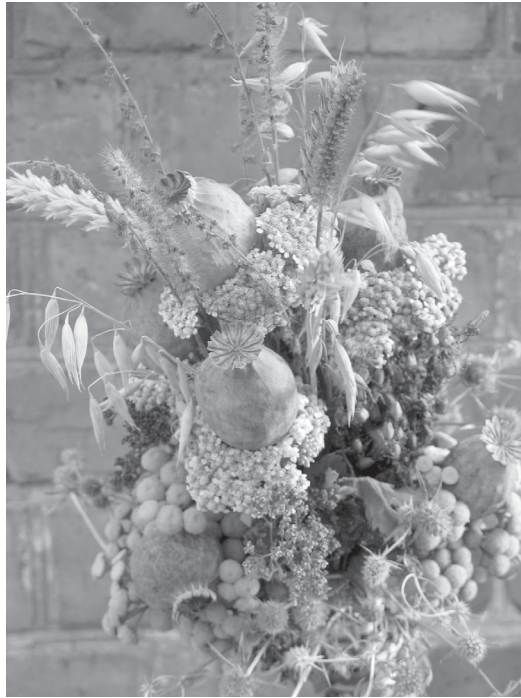
5 pav. Per kankinių Makavėjų šventę (rugpjūčio 14 d.) šventinama puokštė (ukr. k. маковіїчук). Rovnas, 2010 m. birželio 30 d.

pagonybe, anot Bažnyčios, gali kelti rimtą grėsmę dvasinei gyventojų sveikatai. Kai kuriose cerkvėse yra iškabintos atmintinės krikščioniui su jose nurodytu nuodėmių, dėl kurių reikia atgailauti per išpažintį, sąrašai. Tarp nuodėmių yra vizitai pas būrėjas, būrimas, kreipimasis į ekstrasensus, užsiėmimas joga, domėjimasis horoskopais, Naujųjų metų sutikimas pagal Rytų kalendorių.