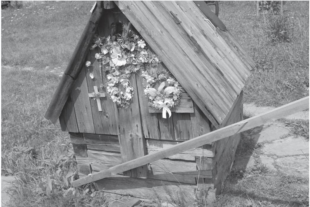
3 pav. Saugos ant kaimo šulinio. Ivano Frankovsko sritis, Mykulyčino kaimas, 2012 m. liepos mėn.

pai yra visuotinai puošiami dirbtinėmis gėlėmis, krepšeliais arba vainikais. Beveik išnyko liaudiška tradicija užkabinti ant kryžiaus išsiuvinėtą rankšluostį. Kaimo vietovėse mažėja ir pačių kryžių, juos keičia akmeninės stelos su jose pavaizduotu kryžiumi. Pagal miesto tradiciją, ypač turint mintyje inteligentiją, populiarius antkapinis paminklas yra kazokų kryžius, savotiškas ukrainietiškojo tapatumo žymuo; jis dažnai pastatomas ir ant ukrainiečių, žuvusių už tėvynės ribų, kapų.