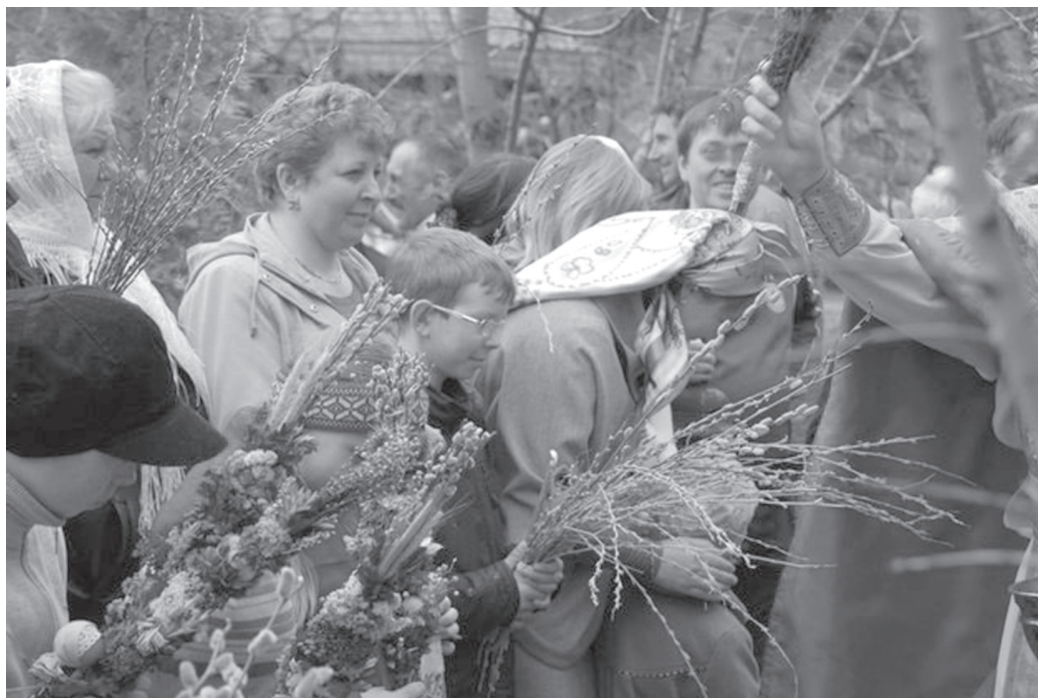
6 pav. Verbos. Kijevo sritis, Kijevo–Sviatošino rajonas, Buzovos kaimas, 2012 m. balandžio 15 d.

Kultūrinis perėmimas kaip kultūrinės integracijos padarinys išryškėjo ir liaudiškojo religingumo reiškiniuose. Verbų sekmadienį miesto cerkvėse vis dažniau galima pamatyti ne tik verbas, bet ir palmių lapus. Šiais metais vienoje Kijevo patriarchato cerkvių (Kijevo srities Kijevo–Sviatošino rajono Buzovos kaime) daug parapijiečių atėjo į šventę su lietuviškomis verbomis. Šie dirbiniai yra lenkų religinės tradicijos dalis ir anksčiau egzistavo Lvovo srityje. Daugeliui Ukrainos gyventojų jos yra žinomos kaip lietuviškos verbos dėl jų, kaip turistinio suvenyro iš Pabaltijo, populiarumo. Šventės išvakarėse šventiko žmona nupirko šias verbas Lvove, ir, kadangi jos buvo gana brangios, daugelis moterų nusipiešė jų pynimo tvarką. Gali būti, jog kitais metais Verbų sekmadienio išvakarėse „verbos“ pasirodys ir Kijevo turguose (6 pav.).