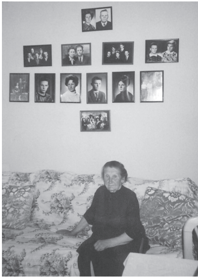
3 pav. Prie šeimos ir giminės nuotraukų. Kėdainių rajonas, 2007 m.

broliu; jos brolio šeima atskirai; jos sesers ir brolio anūkai; dar žemiau iš kairės – Vilniuje gyvenanti jos dukra su vyru; dukros sūnus; ta pati dukra atskirai; sūnus atskirai; antra dukra atskirai; sūnaus šeima; apačioje per vidurį viena nuotrauka – Kotrynos šeima per jos ir vyro auksines vestuves. Akivaizdu, kad visos nuotraukos išdėstytos pagal giminiškumą – tiesiąją ir šalutinę linijas – ir kartomis ir primena genealoginę schemą. Ir tai ne vienintelis atvejis, aptiktas atliekant lauko tyrimus.