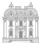
Lietuvių literatūros ir tautosakos institutas