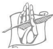
Lietuvos istorijos institutas